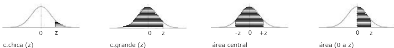
Tabla D.5: ÁREAS BAJO LA CURVA NORMAL ESTÁNDAR